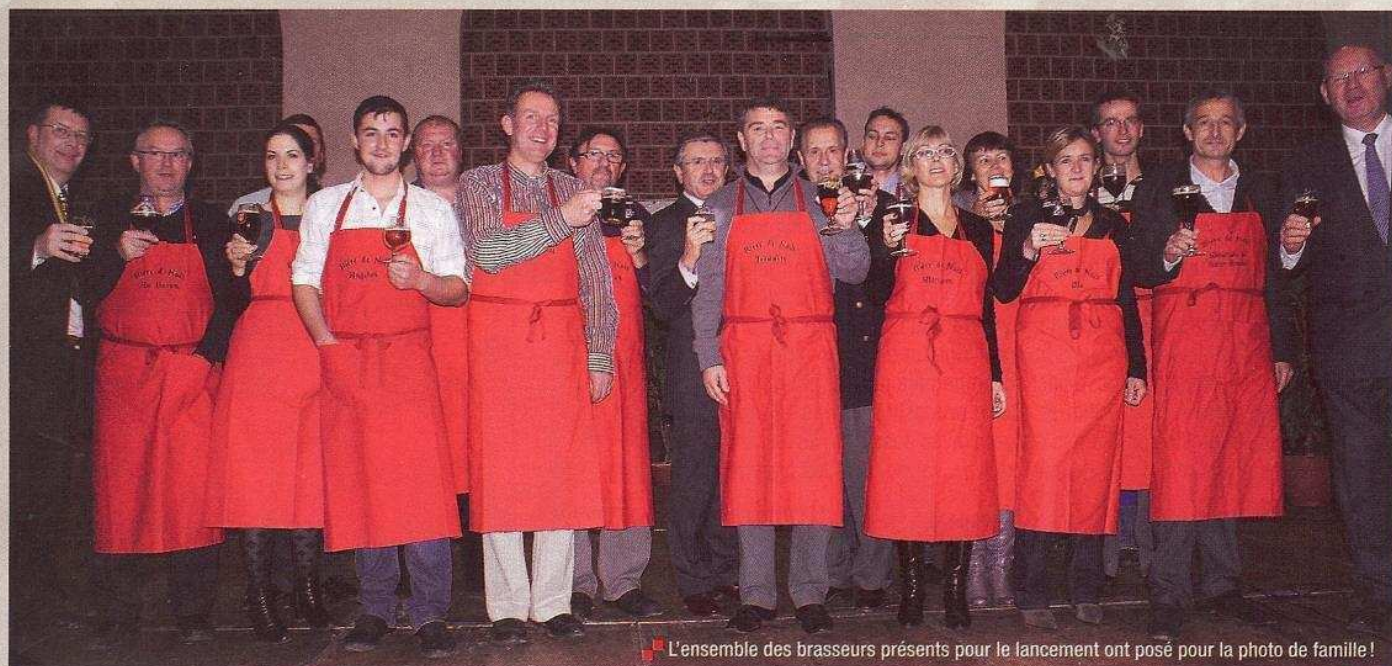
L'ensemble des brasseurs présents pour le lancement ont posé pour la photo de famille !

La tradition a été bien respectée cette année encore pour la présentation officielle des bières de Noël 2010. Une ambiance très chaleureuse a égayé la Halle aux Sucres à Lille en ce mercredi 10 novembre et ce 25 e lancement montre, si besoin était, l'importance de cet événement pour les brasseurs et le public.