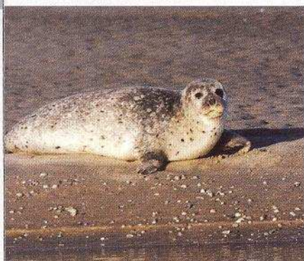
KEVIN WIMIEZ - EDEN62